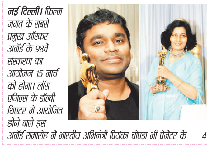
नई दिल्ली। फिल्म जगत के सबसे प्रमुख ऑस्कर अवॉर्ड के 98वें संस्करण का आयोजन 15 मार्च को होगा। लॉस एंजिल्स के डॉल्बी थिएटर में आयोजित होने वाले इस अवॉर्ड समारोह में भारतीय अभिनेत्री प्रियंका चोपड़ा भी प्रेजेंटर के 4:30 बजे से देखा जा सकेगा।

ऑस्कर अवॉर्ड को अकादमी अवॉर्ड भी कहते हैं। इन्हें साल 1927 में शुरू किया गया था, लेकिन पहला अवॉर्ड 1929 में आयोजित हुआ था। 98 साल के इतिहास में भारत की तरफ से 50 से ज्यादा फिल्मों ऑस्कर अवॉर्ड के लिए भेजी गईं, लेकिन एक भी भारतीय फिल्म को ये अवॉर्ड नहीं मिल सका। साल 1957 में पहली बार भारत से महबूब खान की फिल्म 'मदर इंडिया' को ऑस्कर भेजा गया था। लेकिन, फिल्म सिर्फ एक वोट से हॉलीवुड फिल्म 'नाइट्स ऑफ कैबेरिया' से पीछे रह गई और अवॉर्ड जीतने से चूक गई। इसके बाद 1989 में 'सलाम बॉम्बे', 2003 में 'लगाना' और 2004 में मराठी फिल्म 'ध्यास' को फाइनल नॉमिनेशन मिला, लेकिन तीनों ही फिल्में अवॉर्ड नहीं जीत सकीं।