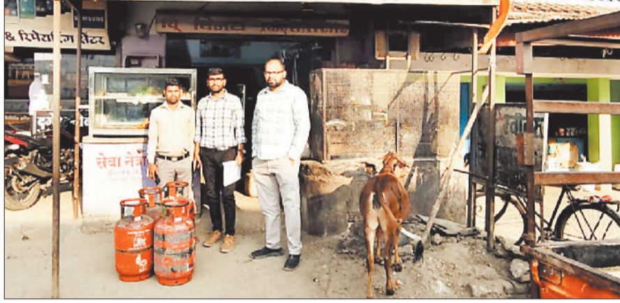
हरिया के विजय स्वीट्स में कार्रवाई करने के लिए पहुंचे संयुक्त टीम।