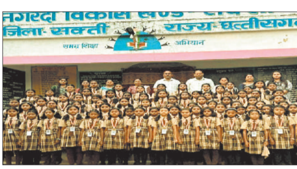
निरीक्षण के दौरान कस्तूरबा विद्यालय में बच्चों के साथ उपस्थित संयुक्त संचालक एवं अन्य।

शासन की विभिन्न योजनाओं के प्रभावी क्रियान्वयन पर विशेष जोर दिया। कस्तूरबा गांधी बालिका विद्यालय नागदा के निरीक्षण के दौरान छात्राओं की उपस्थिति, शिक्षण व्यवस्था, भोजन व्यवस्था एवं आवासीय सुविधाओं का अवलोकन किया गया। इस दौरान उन्होंने छात्राओं से संवाद कर उनकी पढ़ाई एवं सुविधाओं के संबंध में जानकारी भी ली तथा आवश्यक सुधार के निर्देश दिए।